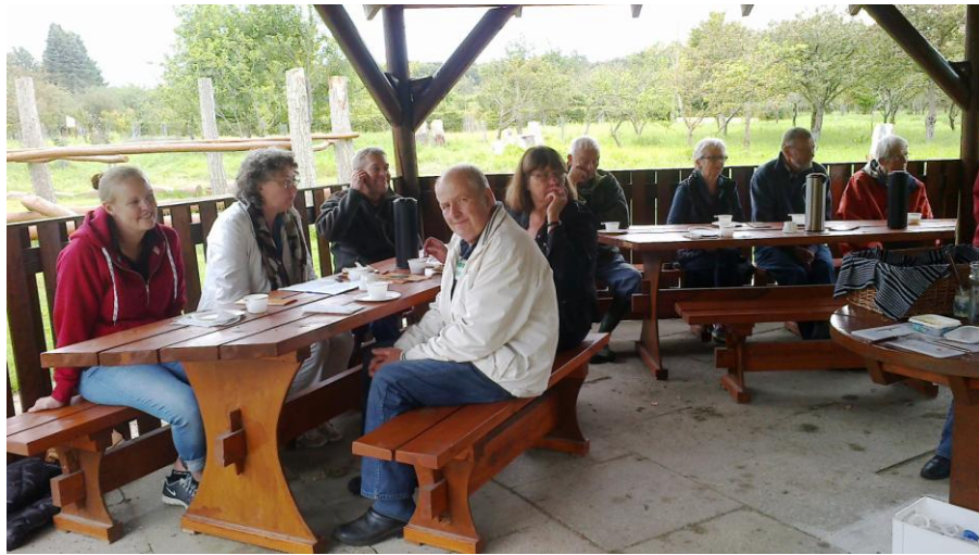
Smagen af Nellemanns Have sættes i gang.

Jeg vil gerne takke alle for et godt arbejdsår. Tak til alle for 2013